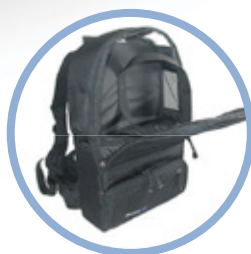
Inogen One G3 ryggsekk**