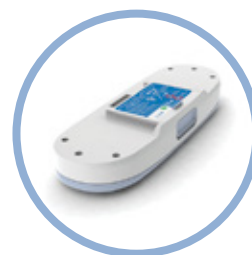
Inogen One G3 lite batteri*