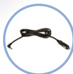
Inogen One G3 12V kabel*