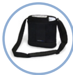
Inogen One G3 veske*