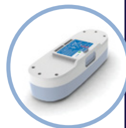
Inogen One G3 stort batteri**